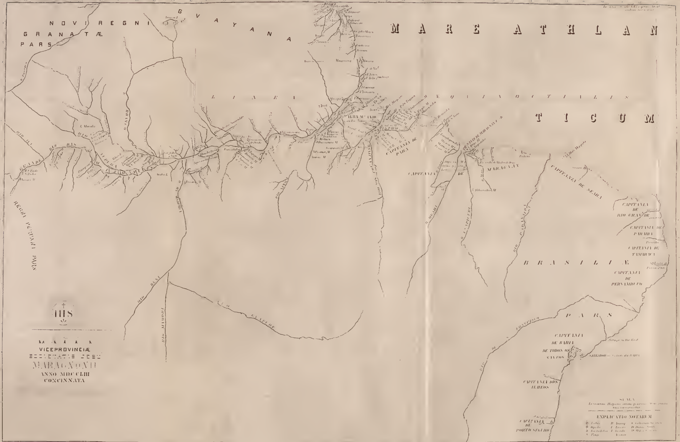
MISSÕES DA COMPANHIA DE JESUS NO GRÃO-PARÁ E MARANHÃO COPIA REDUZIDA DO MAPPA EXISTENTE NA BIBLIOTHECA EBORENSE